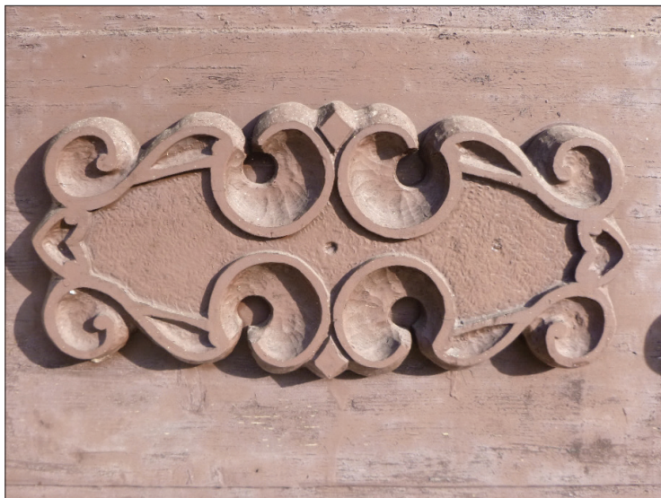
Ozdobná část dveří č.p. 27 Celné

Často chodíme na procházku Celným k Dolanům. Kromě krásné přírody si všimáme podél cesty chalup, jejich stavebních prvků a především nás zaujaly pěkné dveře u mnohých z nich. Truhláři, kteří je vyrobili, museli být z naší obce (tedy Těchonína a Celného), neměli žádné školy a přesto je výzdoba některých dveří malým uměleckým dílem. Na úvod článku uvedeme alespoň jednu z řady vyfocených. Zamýšlela jsem se nad tím, jak vlastně se dřevo z lesa k truhláři dostalo a které stromy se v našich lesích pěstovaly. Na dotazy mám lesníky v rodině