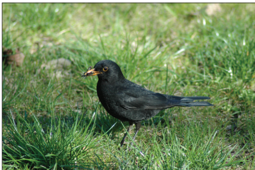
Kos s plným zobákem