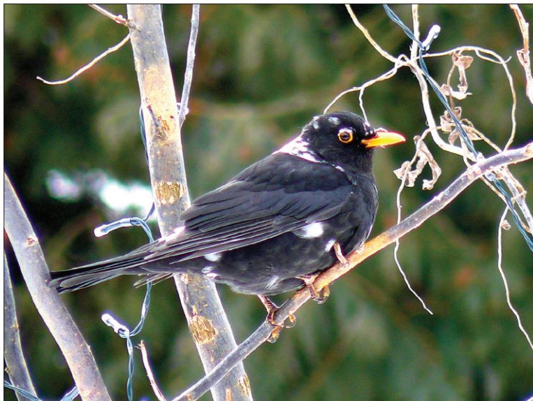
Kos s bílými skvrnami - leucismus

nemůžeme tolik krásných snímků zveřejnit. Teď tedy dodám jen některé zajímavosti z kosího života. Kos černý býval plachým lesním ptákem, po několik generací však je povětšinou již ptákem lidských sídel. Máme tedy kosy lesní a více již kosy městské. Z dědictví kosů z lesa si zachovali úžasnou obratnost v letu. Zvláštní je kosí zobák – má opravdu praktickou úpravu: horní čelist protaženou do špičky, trochu nad spodní a má na hranách rohovitě vroubkování. To kosům pomáhá udržet kluzkou kořist, třeba žížaly. Jinak se živí brouky, plži, larvami hmyzu a v době zrání ovoce přecházejí na „bobulovou“ dietu. V zimě pak jsou hlavní hosty našich krmítek. Kos je částečně tažný, odlétají především lesní kosi. Hnízda staví v hustých keřích, ve větvích stromů, ale i na budovách. Hnízdí dvakrát až čtyřikrát do roka, ale ze 3 – 6 modrozelených vajíček s rezavými skvrnami se prý vylíhne potomstvo nejvýš ze 45 procent a z nich pak jen 40 procent přežije první narozeniny. A pozor – ještě polovina z nich pak zahyne v následujícím roce. Kosí pár krmí mladá 12 až 15 dnů a po vylétnutí je ještě čtrnáct dní přikrmuje. Kosí mláďata v křoví se silným (prý žebavým) hlasem dožadují na rodičích potravy (nejsou vypadlá z hnízda – nesbírat). I když by se mohl kos dožít 20 let, jeho průměrný věk je jen dva roky.