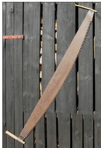
Pila břichatka (kaprovka)