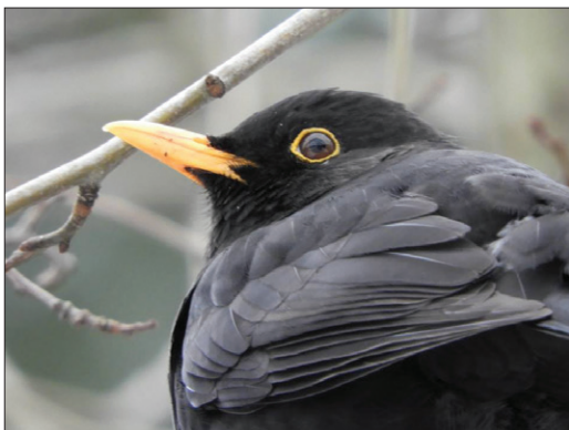
Kos černý

Popisovat Vám kosa nemusím, fotografie, jež jsem získala od přátel ze skupiny, jsou výmluvné. Mimořádně – požádala jsem o fotky, samozřejmě zdarma - a během chvíle jsem jich měla spoustu, tudíž jsem musela dodávku ukončit a je škoda, že