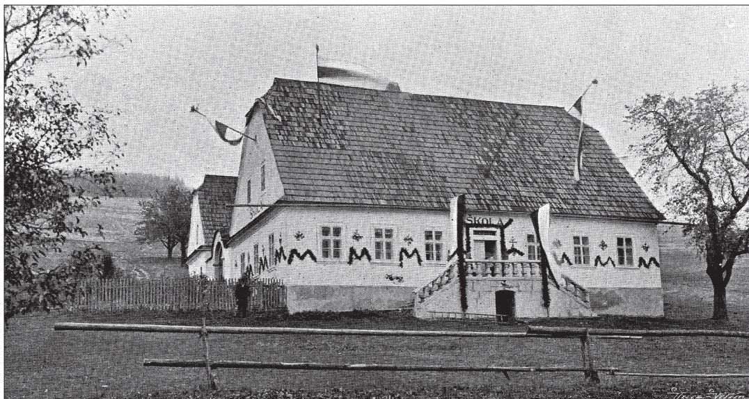
Česká menšinová škola v čp. 58, která byla založena 14. září 1904.