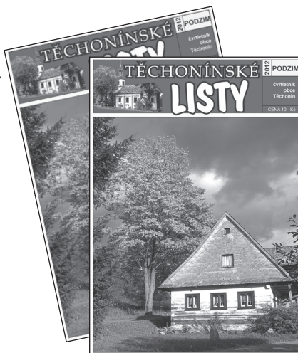
Foto na obálce: Typická podorlická chalupa v Hluchově