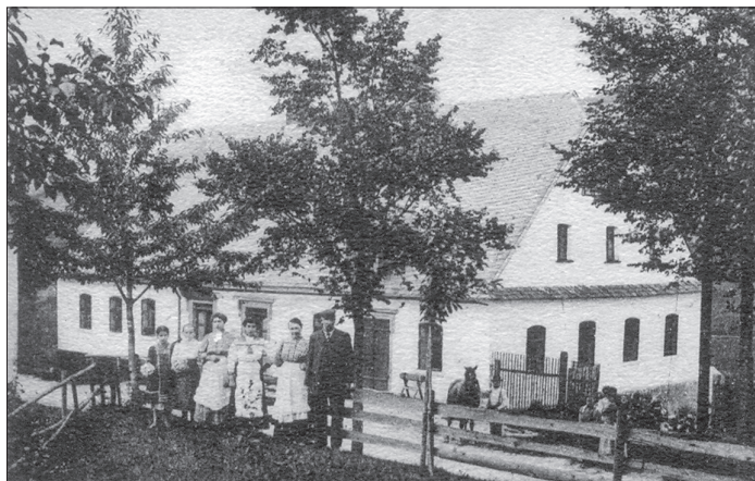
Hospodářská budova pod německou školou (nedávno ještě budova Státního statku).