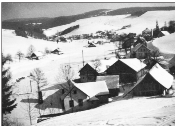
Pohled na mlýn