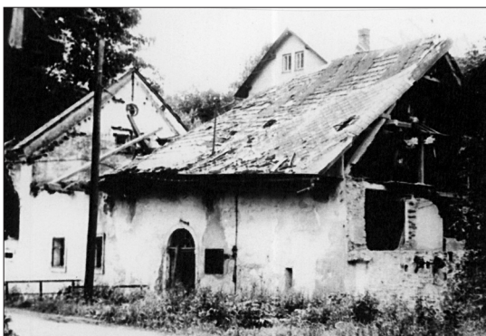
Trosky mlýna a pily na Celném