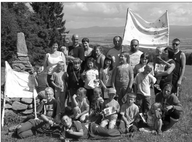
Kompletní osazenstvo soustředění SDH Mladých hasičů na Adamu