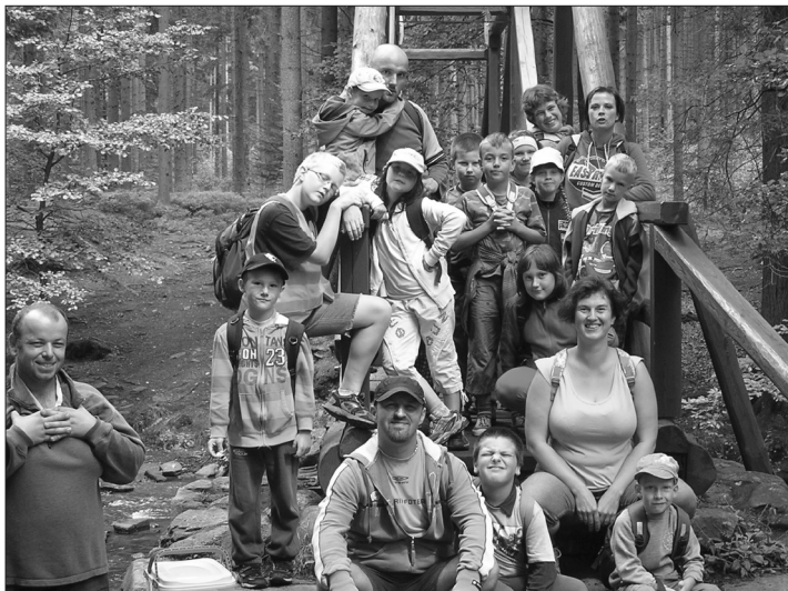
Jeden z cílů celodenního výletu - Pašerácká lávka