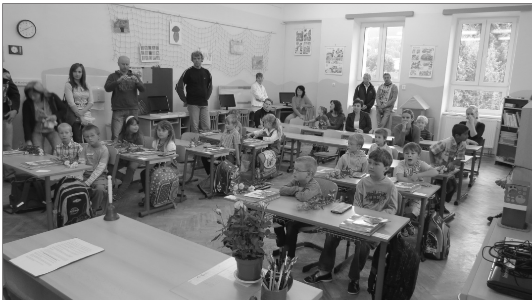
První den v lavicích pro nové prvňáčky...

Chtěla bych poděkovat všem, kteří se na úklidu podíleli. Patří mezi ně také maminky, které nám v polovině týdne s úklidem přišly pomoci. Věřím, že by ochotných maminek přišlo mnohem víc, ale všechny jsme oslovit nemohly, protože se nedalo uklízet více míst najednou. Přesto bych i jim chtěla poděkovat za zájem. Největší dík patří panu starostovi, protože bez jeho aktivit by k tak velkým změnám ve škole nedošlo.