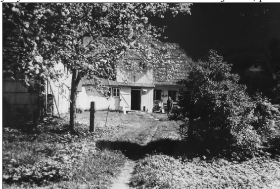
Mlýn v Hluchově