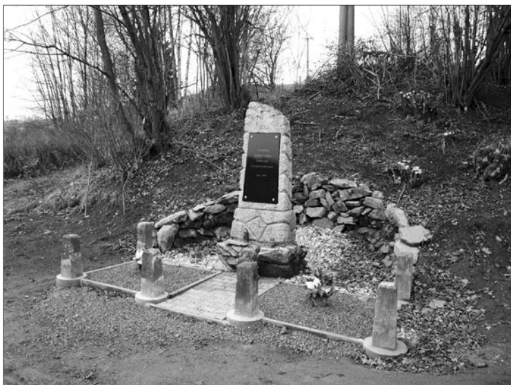
Pomník na Celném

Je jisté, že podobně jako u nás se odehrávaly příběhy lidí v první světové válce i v jiných obcích a v jiných zemích. Bohužel se lidstvo nepoučilo.