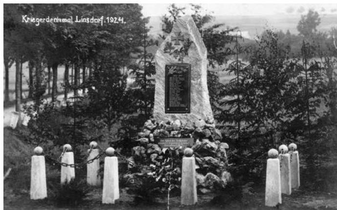
Pomník v Těchoníně

Válka si v Těchoníně vyžádala 24 obětí, v Celném padli