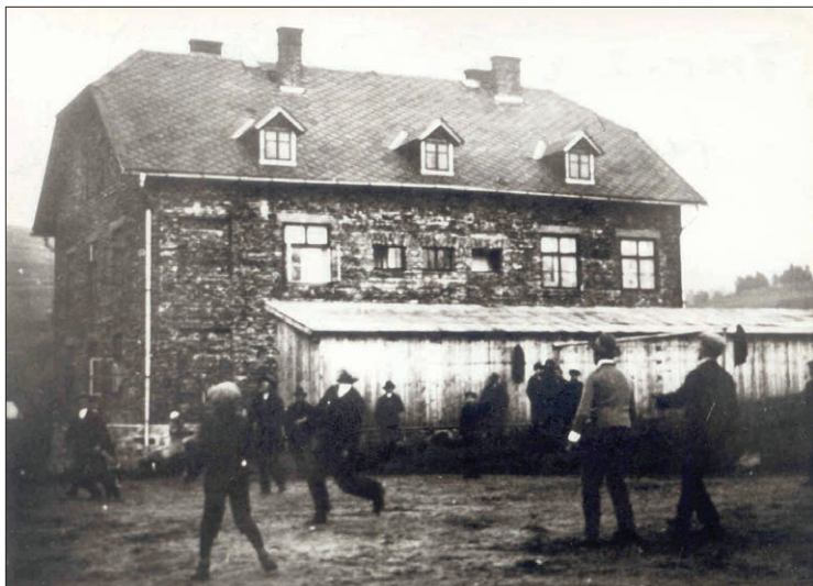
Obecní úřad 1932-34