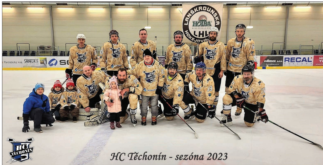
HC Těchonín - sezóna 2023

Jako každé hokejové vedení se i těchonínský GM dívá pořád dopředu. Se všemi hráči týmu vedení komunikovalo a můžeme být rádi, že do 13. sezóny vstoupíme ve stejném složení. Parta v šatně i na ledě drží při sobě a „hokejový duch“ vládne týmu. V sezóně jsme stihli uspořádat jednu volné bruslení pro občany Těchonína. A za co jsem opravdu rád, tak jsme se všichni složili a po domluvě s vedením těchonínské školky koupili dětem z Těchonína pár hraček. O všem, co se v týmu děje, se dozvíte na facebookových stránkách HC Těchonín, kde jsou pravidelně zveřejňovány výsledky, nadcházející zápasy i zajímavosti.